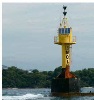
La cardinale des Moines