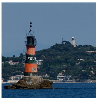
Danger Isolé: la Fourmigue devant le phare de la groupie