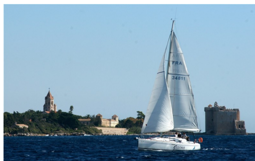
Toulahé devant le monastère de Saint Honorat